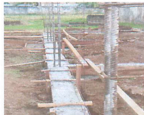
Foto 6 - Execução da viga baldrame