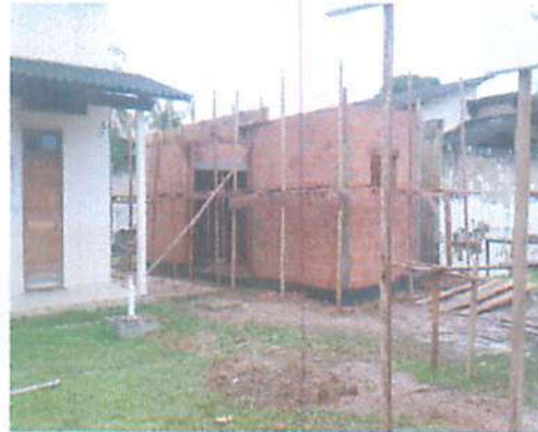
Foto 8 - Execução da alvenaria