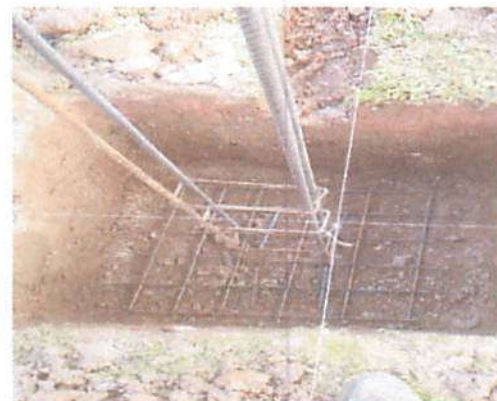
Foto 4 - Execução de vala para fundação