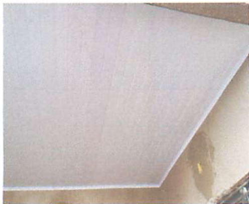
Foto 13 - Execução do forro e das instalações elétricas