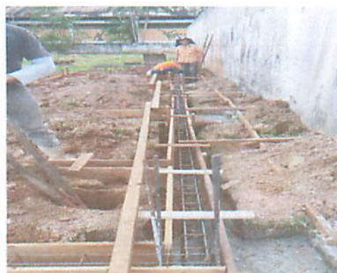
Foto 5 - Fôrma da viga baldrame