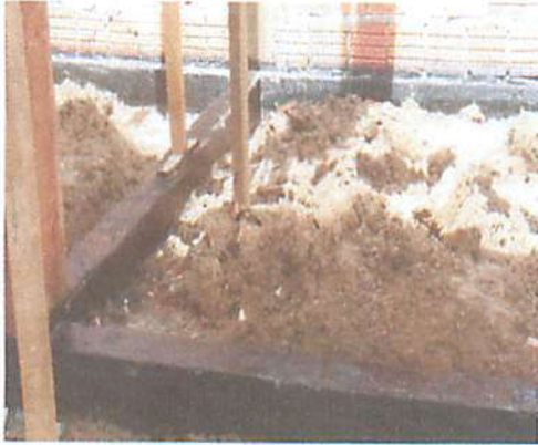
Foto 7 - Impermeabilização da fundação