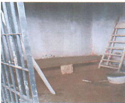
Foto 11 - Execução do banco de concreto