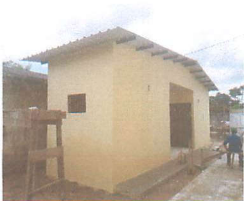
Foto 15 - Execução da pintura