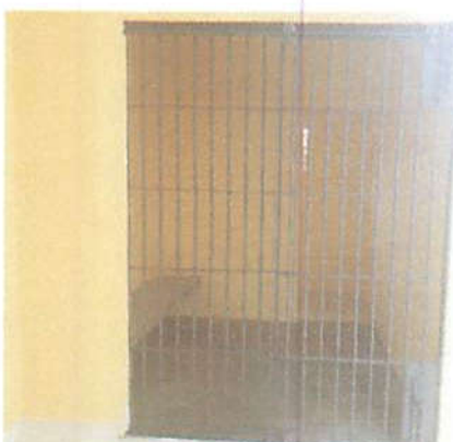
Foto 18 - Esquadria de aço concluída