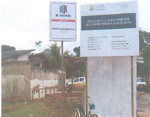
Foto 1 - Placa da obra em Plácido de Castro