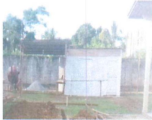
Foto 2 - Execução de depósito no canteiro de obras