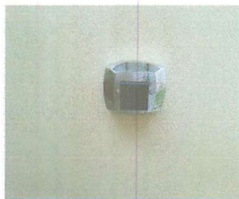
Foto 16 - Válvula de descarga concluída