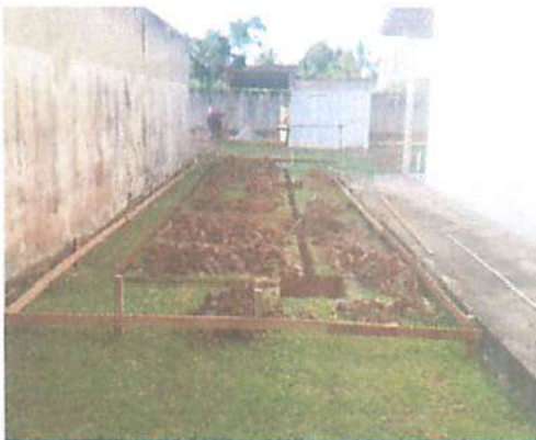
Foto 3 - Locação da obra