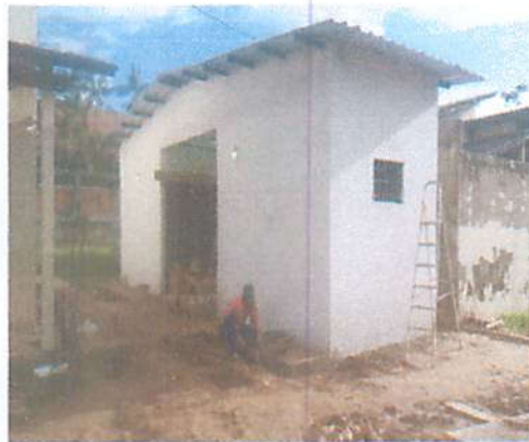
Foto 14 - Cobertura concluída