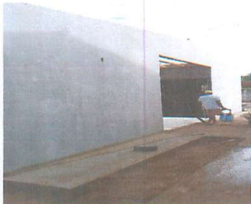
Foto 12 - Execução da calçada