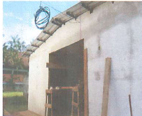
Foto 10 - Revestimento de parede concluído