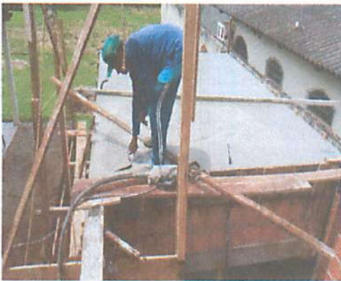
Foto 9 - Execução da laje